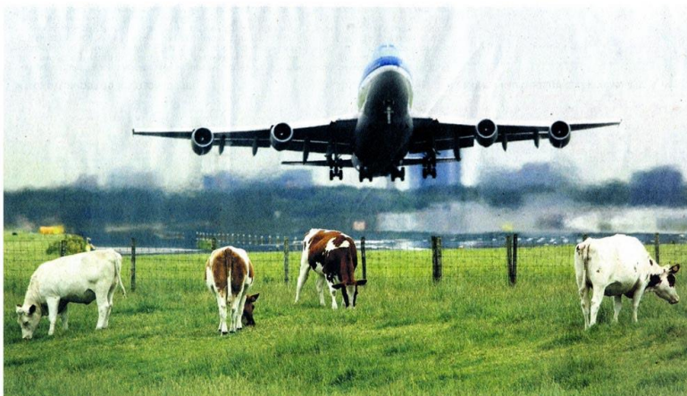
Binnen de Cros wordt dit jaar de uitvliegeroute van de Kaagbaan een hot item.